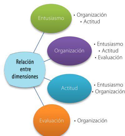
Figura 2 – Dimensiones con correlación de Spearman “positiva fuerte” y “perfecta”.

En los casos en que se rechaza la hipótesis nula y, por tanto, ha de ser aceptada la hipótesis alternativa, el valor de correlación tiene distintos valores. Estos valores pueden ser interpretados según Hernández Sampieri y Fernández Collado (1998) como “Correlación positiva fuerte” para valores desde “+0,76 a +0,90” y como “Correlación positiva perfecta” para valores de “+0,91 a +1,00”. Por tanto, en la Figura 2 mostramos aquellas dimensiones para las cuales existe una correlación “positiva perfecta” y también se han añadido las correlaciones “positivas fuertes”.