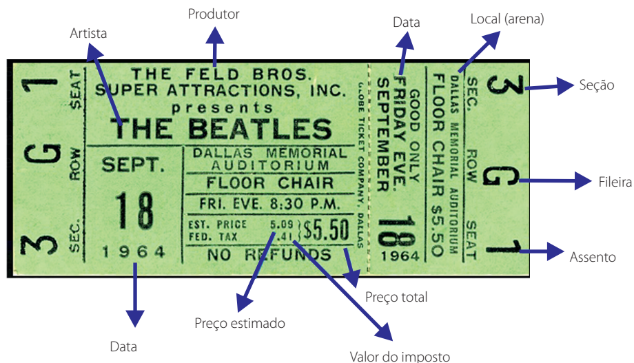
Figura 1. Metadados de negócio em ingresso de show