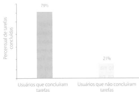
Gráfico 1. Eficácia de usabilidade da BVS.

Para analisar os dados obtidos com aplicação do teste de usabilidade na BVS, definiu-se como parâmetro