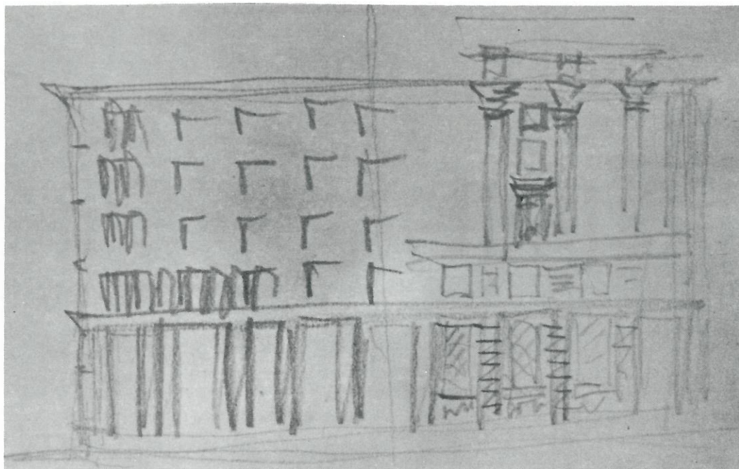
Ilustração 2 - Desenho de Marcello Piacentini

não se trata de uma vista da cidade, de uma forma resultante que necessite de um espaço além de seus limites; a elevação que temos na ilustração 1 é a “verdadeira grandeza” das proporções, dos ritmos, da compreensão da pauta, autônoma de qualquer determinação “exterior”. As medidas são dadas em termos absolutamente visuais; neste sentido, esclarece-se a força plástica de cada elemento na hierarquia compositiva: porta, pilastras, aberturas e relevos. Notas de uma harmonia visiva, as formas do universo clássico para Piacentini, no decorrer de sua obra, irão se tornar “formas estruturais”: é o “arquiteto que em suma procede, compondo, como o pintor: tenta linhas, sente a necessidade de claros e escuros, de formas genéricas, não de colunas, de capitéis e de outras formas” 12 ; o que lhe interessa são valores visuais, dos quais podem ser extraídos, a partir destes elementos, o caráter construtivo das formas na cidade.