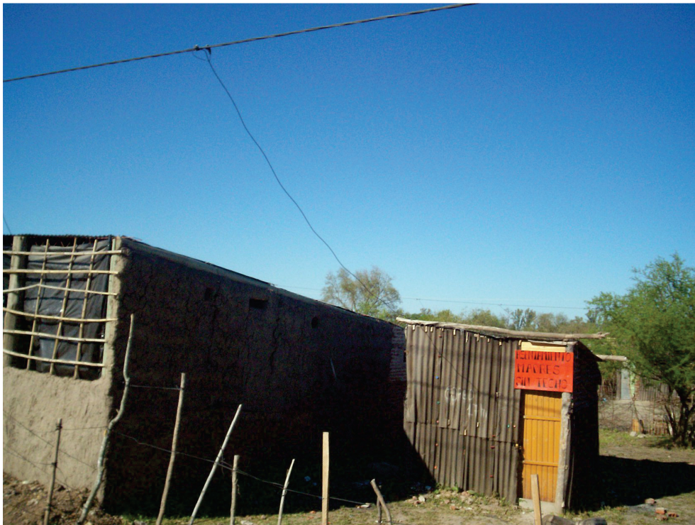
FIGURA 7 — Asentamiento La Rubita en Julio de 2008.