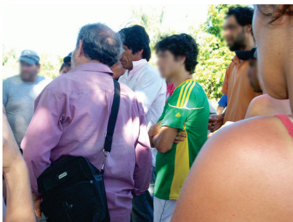
FIGURA 4 — Ocupación de La Rubita en octubre de 2007. Ocupantes organizando la resistencia al desalojo.