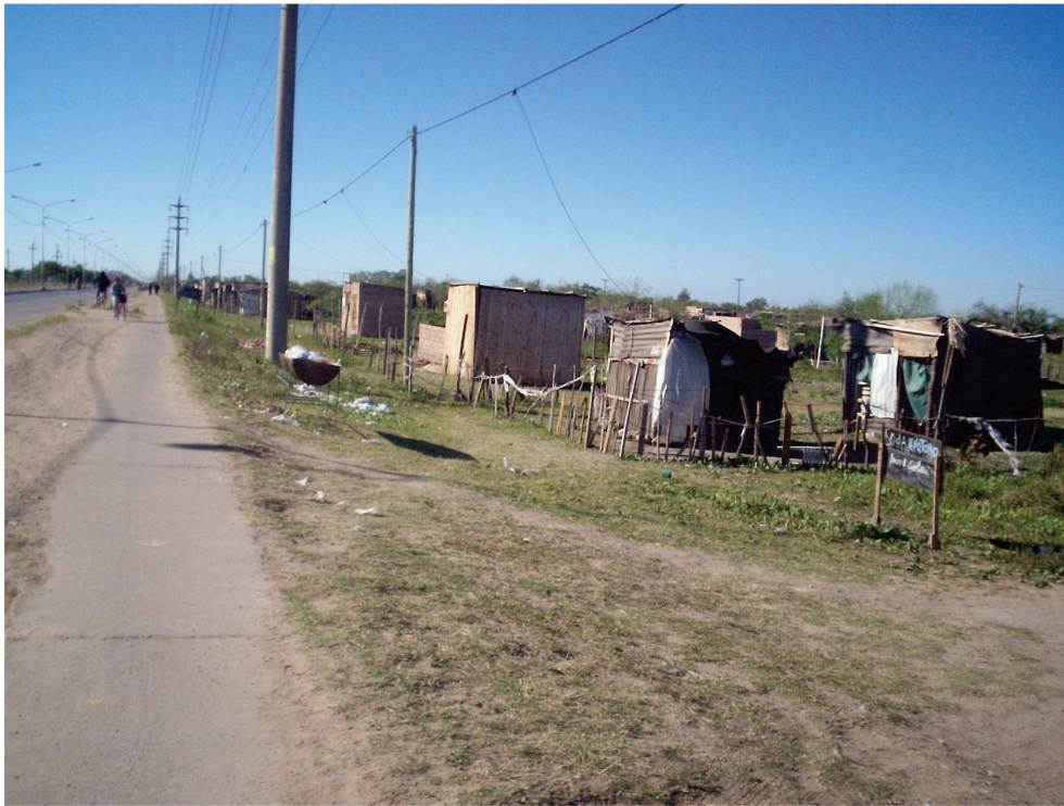
FIGURA 6 — Asentamiento La Rubita en Julio de 2008.