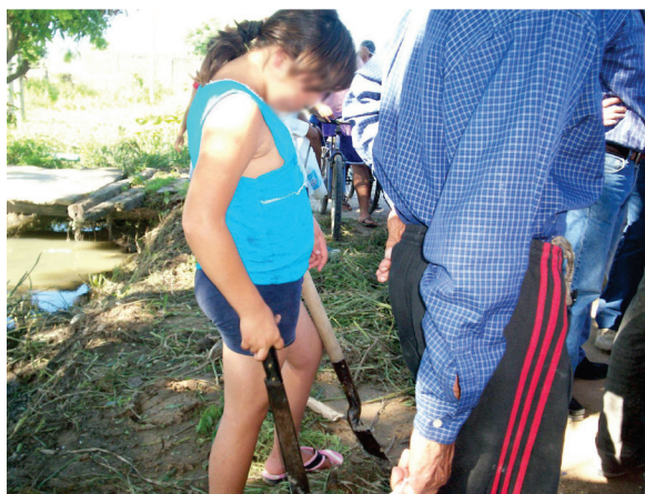
FIGURA 5 — Ocupación de La Rubita en octubre de 2007. Familias ocupantes organizando la instalación.