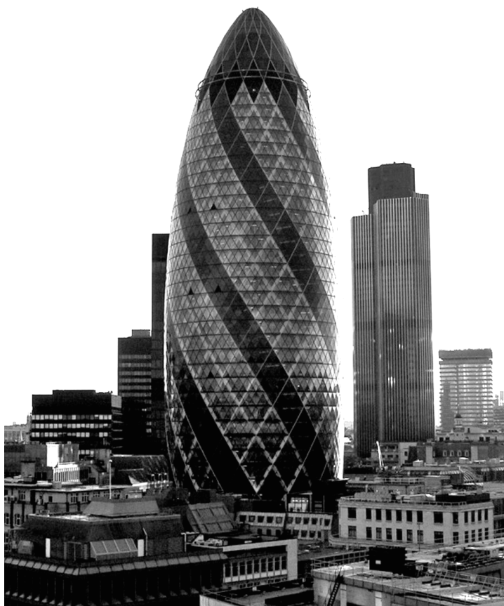
Foster & Partners – Swiss Re, Londres.

Además, existe un alto porcentaje de personas no dedicadas directamente a la arquitectura, y que desempeñaran dentro del estudio labores de: