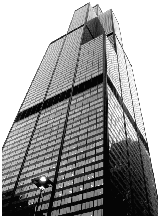
SOM – Sears Towers, Chicago (1973).

Suele tratarse de una base de arquitectos jóvenes de diversas nacionalidades, altamente cualificados y con un alto grado de rotación dentro de los grandes estudios internacionales. Por lo general poseen un alto conocimiento de idiomas, aunque el idioma común será el inglés a la par que el idioma local. Pese a su cualificación depurada por un alto proceso de selección, por lo general pasan a desempeñar labores de delineación CAD y modelismo simple con poca involucración en la creación proyectual, en manos de la jerarquía superior.