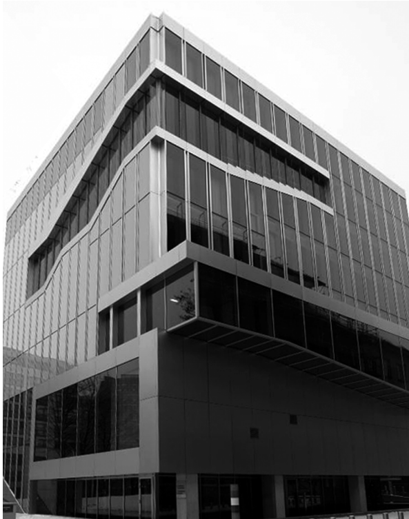
OMA – Embaixada dos Países Baixos, Berlim.

OMA: al inicio del proyecto, todos los miembros del equipo deben producir una propuesta definida mediante maqueta y dibujos. Algunos de sus proyectos más emblemáticos parten así de la aportación de sus becarios.