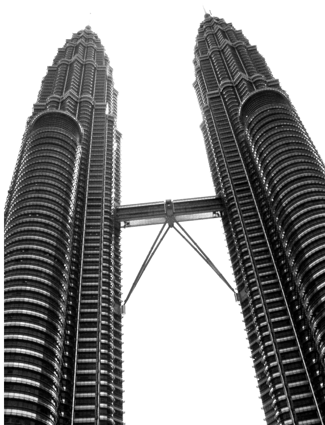
Cesar Pelli & Associates – Torres Petronas, Kuala Lumpur.

Esta titulación viene acompañada de importantes reducciones fiscales, así como de una apreciada publicidad que incrementa el valor de la construcción. De este modo, y con iniciativas similares, los clientes se convierten en los primeros interesados en una arquitectura respetuosa con el medio ambiente, que esperamos se convierta en norma común.