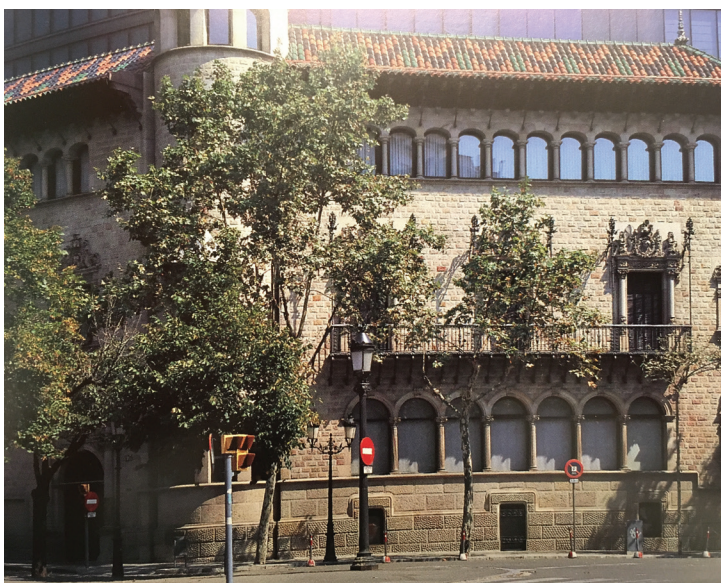
FIGURA 4 — Casa Serra.

marcarían la diversidad de lenguaje existente entre la producción arquitectónica castellana y la catalana. En relación al Románico de otras partes de Europa, por ejemplo, del norte de Italia, Puig i Cadafalch (1920) identifica como característica única del Románico catalán el techo de bóvedas de cañón. No sólo los techos pétreos abovedados, sino también el arco catalán, se han convertido en signos característicos de la identidad de la arquitectura catalana. Ejemplos de su interpretación — no directa aplicación ecléctica — en la arquitectura Modernista se pueden ver en las bóvedas catalanas y arcos aplicados en la Casa Martí i Puig (el Quatre Gats), en el Claustro del Monasterio de Montserrat, en la Casa Macaya o en la Casa Serra.