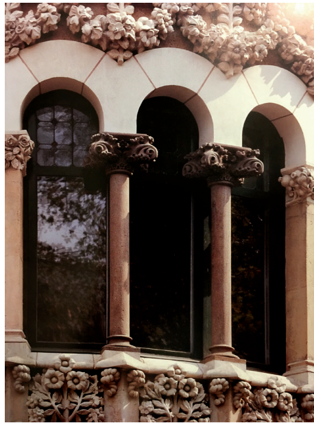
FIGURA 6 — Detalles ornamentales Casa Terrades. Fuente: Archivo de los autores (2012).

En la postura de historiador de Josep Puig Icadafalch subyace un argumento altamente político, que asocia el desarrollo del lenguaje artístico y arquitectónico con la expansión mediterránea de Cataluña. El estilo y su lenguaje, pues, es generado por la identidad de un pueblo, inseparable de sus instituciones y costumbres, y de su devenir histórico. Sólo las condiciones particulares de Cataluña podrían generar su peculiar lenguaje arquitectónico Románico, reflejo de un pueblo industrial, capaz de producir mucho con pocos recursos. En un esfuerzo por universalizar su estudio, Puig se ocupa de verificar la hipótesis de que las leyes que rigen la relación entre la gente y el estilo de la Edad Media en Cataluña son aplicables a otros países europeos (PUIG I CADAVALCH, 1920).