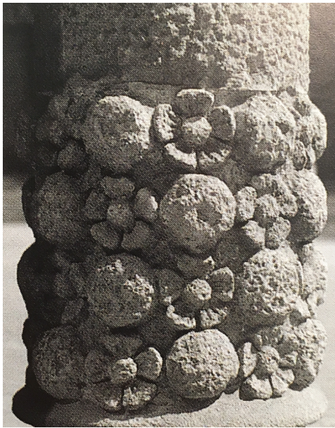
FIGURA 5 — Detalles ornamentales Casa Terrades.