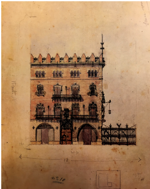
FIGURA 1 — Casa Martí i Puig. Fuente: Dibujo original Puig i Cadafalch (1896), archivo de los autores.

Según Puig i Cadafalch (1920), uno de los primeros rasgos diferenciales del lenguaje arquitectónico catalán respecto al castellano se debería al patrimonio cultural árabe propio de la Península Ibérica, frente al romano de la Cataluña Mediterránea. Los orígenes diversos