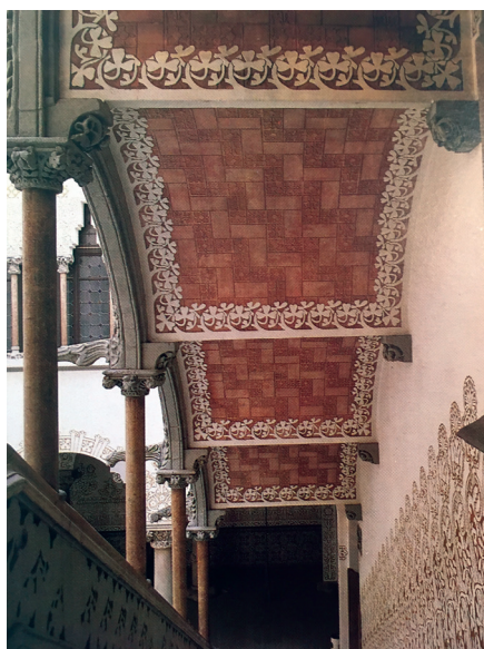
FIGURA 3 — Casa Macaya.