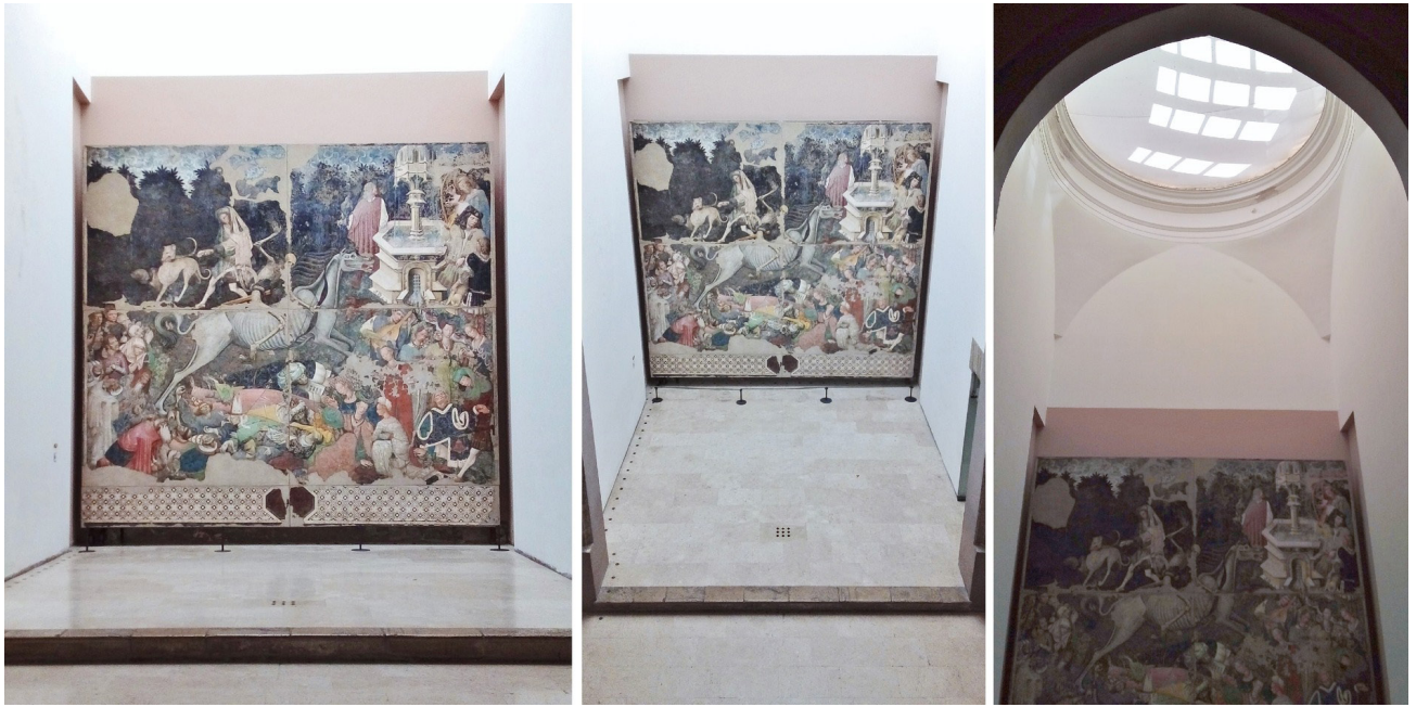
Figura 5 – Afresco Triunfo da Morte (esquerda), vista a partir do mezanino (centro), e vista da zenital.

deve ao desenho exclusivo e à pedra nobre; no “Busto di giovinetto” (Figura 6), atribuído à Laurana, o pedestal robusto de seção quadrada é formado por quatro sarrafos retangulares associados “em rotação”, com fendas entre eles, e a obra foi fixada sobre o próprio à altura da visão; pedestal similar foi utilizado no busto policromado da sala da “Madonna del Riposo”, de Antonello Gagini (1478-1536), mas este tem como suporte uma placa retangular de pedra: cada obra é tratada de modo específico, e os expositores atuam como próteses. Vale mencionar também a mísula da “Testa di gentildonna” atribuída à Laurana, utilizando uma secção de tronco rústico de madeira engastado ao painel lateral através de perfil metálico (Figura 6).