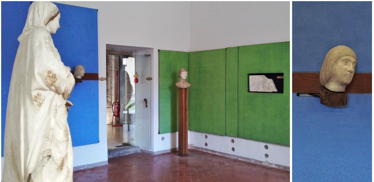
Figura 6 – A Sala Laurana com pormenor da “Testa di gentildonna” suspensa.