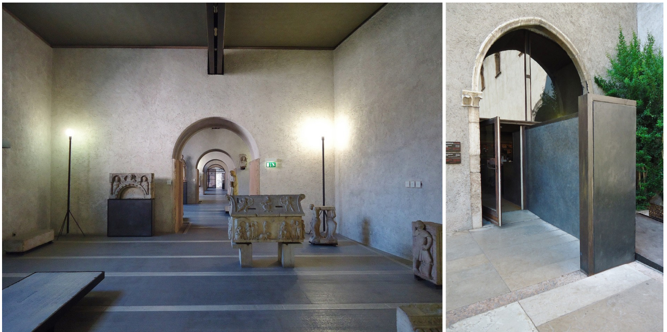
Figura 9 – Viga de aço sobre a enfilade e o arco ogival de entrada (direita) e saída com o muro.

A obra começou na ala della Galleria com a limpeza de elementos falsos da intervenção de Avena, como o forro de caixotões e os estuques “renascentistas” e “barrocos” que encobriram pinturas e afrescos originais de outras épocas que foram recuperadas. O entrepiso de madeira é substituído pelas lajes apoiadas na viga de aço contínua sobre a enfilade de portas em arco pleno (Figura 9). Scarpa também reabre a porta del Morbio, a última, fechada por Avena, obtendo continuidade do percurso para a ala della Reggia , além do acesso ao segundo piso pela escada inserida no Mastio . Como em Palermo, a parte inferior foi novamente dedicada às esculturas e peças tridimensionais, e a parte superior às pinturas. Os suportes definitivos desenhados peça a peça foram refinados, com o espaço permitindo a reutilização das plataformas expositivas baixas de Uffizi.