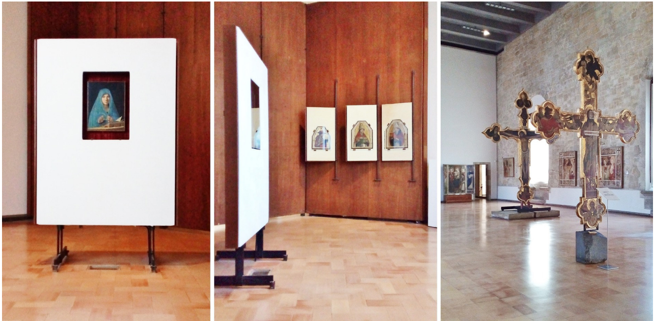
Figura 7 – O cavalete- passepartout diagonal (esquerda), os painéis pivotantes (centro), e as cruzes pintadas do século XV sobre suportes distintos (direita).

Outro destaque do museu é a sala da Annunziata de Antonello da Messina, obra inserida sem moldura em amplo cavalete- passepartout branco, colocado em diagonal para receber a luz da janela; e os “Três Santos Doutores”, do mesmo, fixados à painéis brancos pivotantes manuseáveis (Figura 7), recurso utilizado na exposição de Klee (1948) referida. Ele já havia retirado molduras de quadros em exposições como Giovanni Bellini, realizada no Palazzo Ducale de Veneza em 1949, tentando transferir as obras para o presente, ao que parece. Ainda merecem nota os suportes de elementos verticais, como as cruzes pintadas do século XV, no Salone delle Croci , utilizando encaixes de metal e blocos de pedra ou concreto (Figura 7).