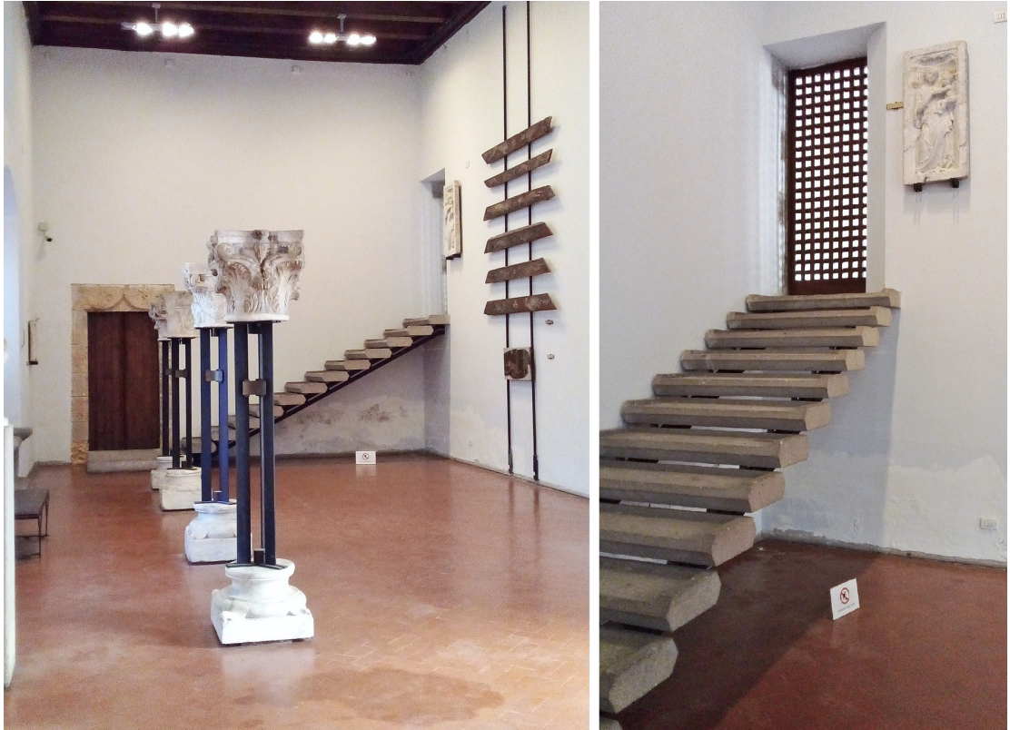
Figura 4 – A escada escultórica na sala dos capitéis com “próteses”.

dos degraus de concreto pré-moldados com perfil hexagonal (Figura 4). Soluções deste tipo compuseram o padrão de intervenções idealizadas pelo restauro crítico-conservativo que sucedeu o restauro crítico, pelo uso de formas modernas acentuando a “distinguidade” e “reversibilidade”. Ocorreram também pequenas subtrações de paredes, predominando o uso de revestimentos e painéis leves, em sintonia com a “intervenção mínima” que completa o tripé do restauro crítico.