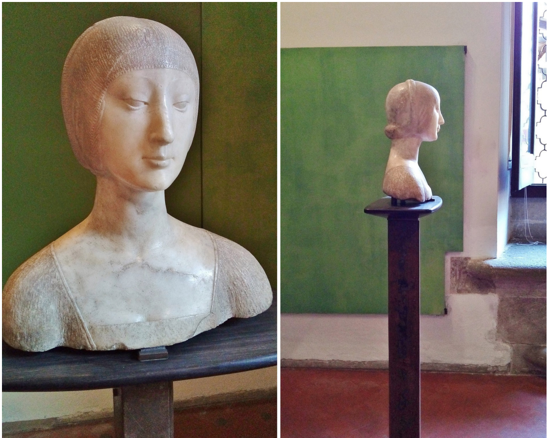
Figura 2 – O Busto de Eleonora de Aragona sobre o pedestal de ébano.

Outra prioridade em seu trabalho museológico foi a iluminação do acervo. A preferência pela luz natural convergia com Kahn, autor da Galeria de Arte da Universidade de Yale (1951-1953),