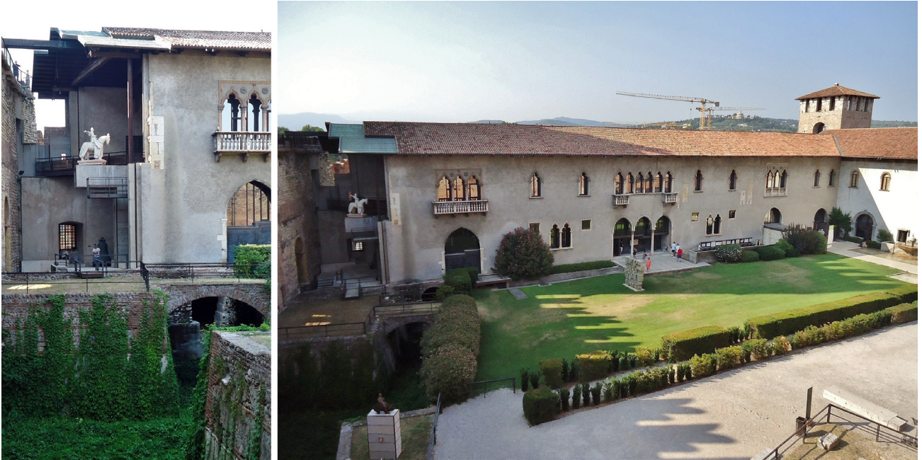
Figura 8 – Ala napoleônica, com a composição falsa de aberturas e o novo arremate.

(D'anniballe, 2010, p. 76). As torres foram recompostas de modo semelhante a Viollet-le-Duc, e a fachada da ala napoleônica recebeu a atual composição simétrica de aberturas variadas, utilizando molduras góticas de pedra das construções destruídas pela grande enchente de 1882 (Figura 8). Bombardeado em 1945, o edifício teve a última configuração reconstituída após a guerra, sendo respeitada de modo predominante por Scarpa, confirmando sua postura favorável à preservação dos diversos momentos das obras e conjuntos, passível de ser definida eclética: outra medida seria um erro maior. Entretanto, uma série de lacunas na estrutura, necessidades técnicas e funcionais da renovação e oportunidades plásticas diferenciam esta intervenção da anterior, resultando na inserção de acréscimos e a remoção de partes de diferentes épocas.