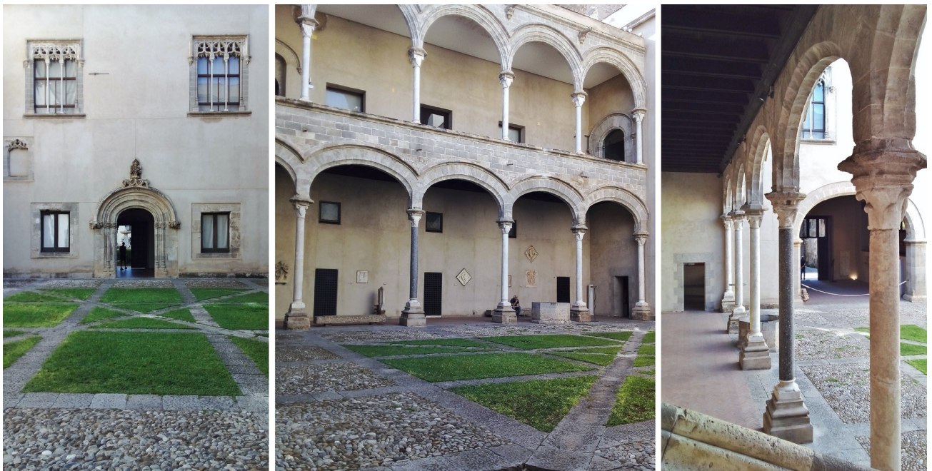
Figura 3 – Vista do pátio a partir do ingresso (esquerda), loggia lateral direita reconstruída (centro), e vista da loggia para o ingresso (direita).

Poucos elementos construídos foram inseridos por Scarpa no edifício reintegrado, como a escada de lance único junto à parede, na Sala VI, utilizando vigas metálicas como suporte