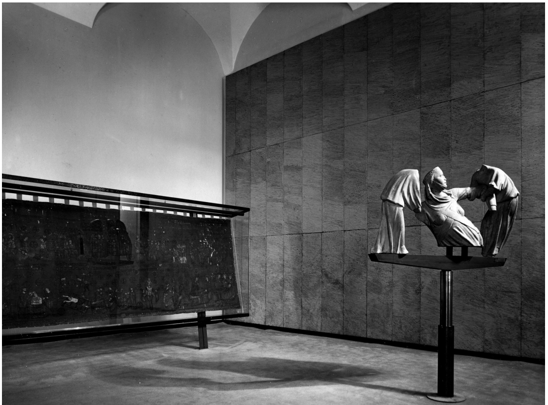
Figura 1 – O pedestal hidráulico da escultura de Pisano contra o fundo revestido com painéis suspensos.

A seguir, Albini interferiu na Galleria di Palazzo Rosso (1952-1962), também em Gênova, desta vez com Franca Helg (1920-1989), iniciando a parceria fecunda no segmento do desenho de