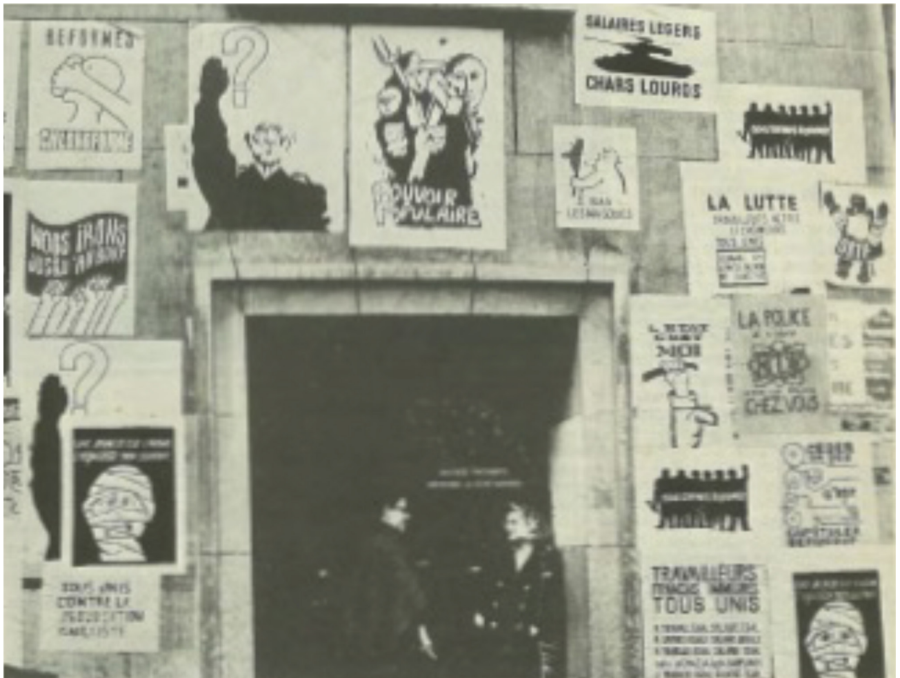
Figura 1 – Imagem que ilustra o artigo “Mort de l’Ecole des Beaux-Arts” de autoria de Françoise Choay.

corporativo herdado de Vichy e utilizado essencialmente para manutenção de privilégios” (Choay, 1968, p. 13, tradução nossa).