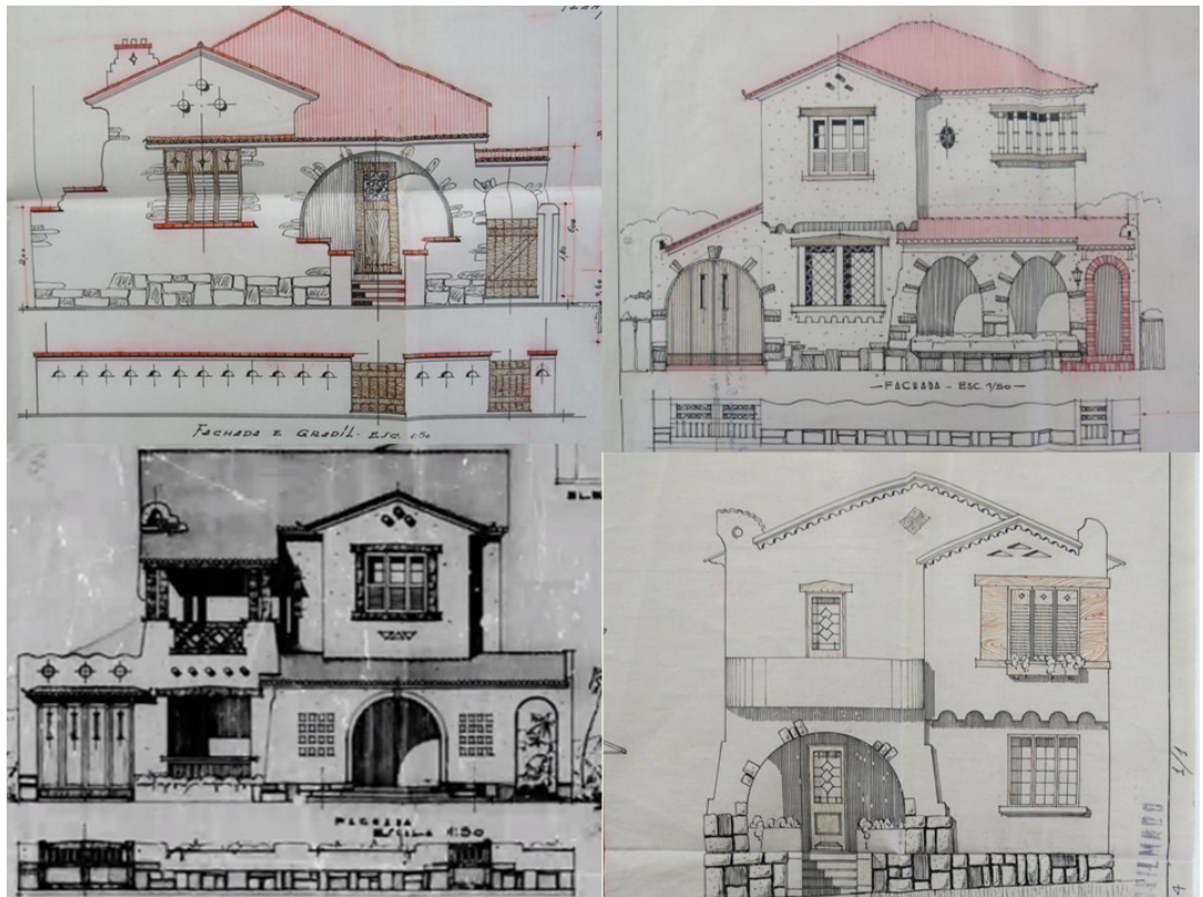
Figura 7 - Exemplo do emprego dos três cilindros de argamassa, das faixas lombardas e dos triângulos em baixo relevo.