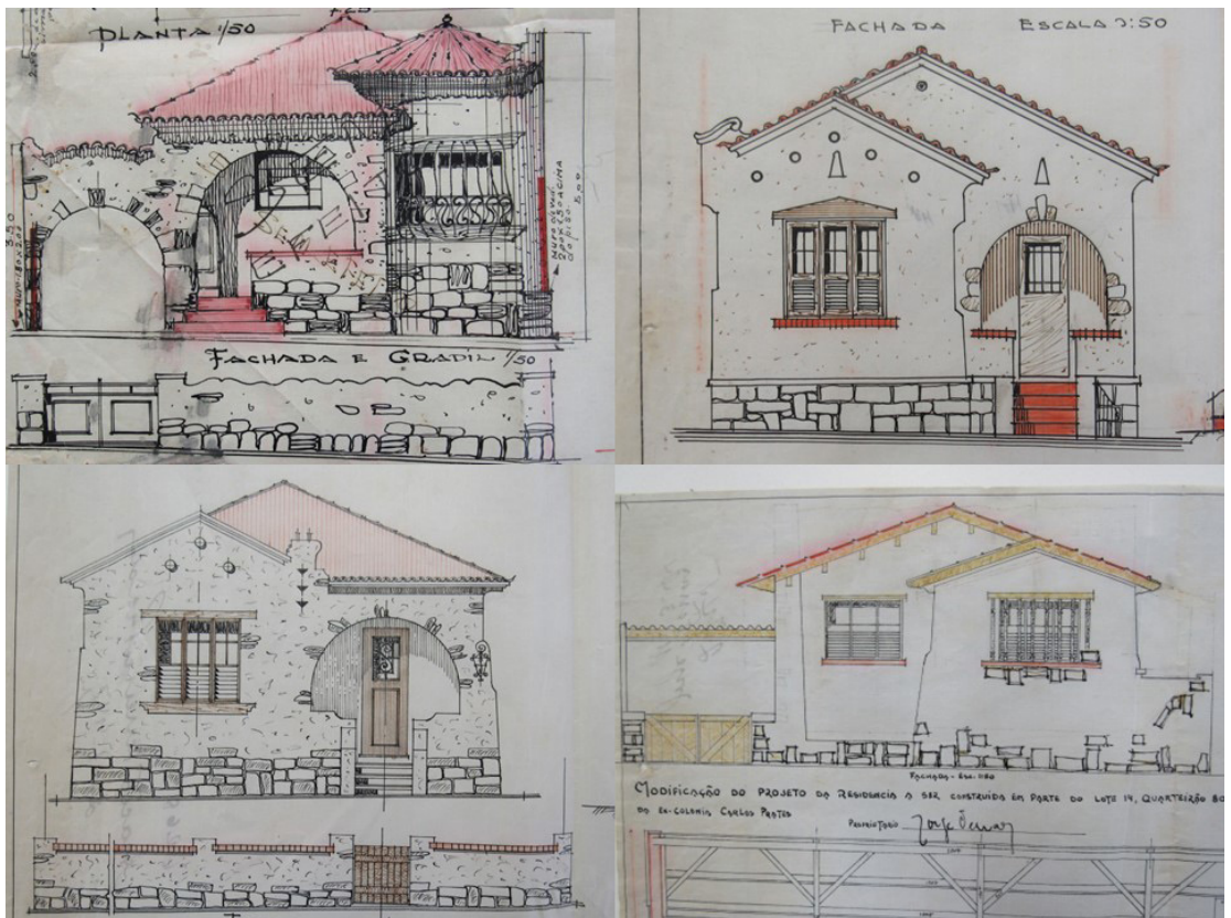
Figura 10 – Tipologia recorrente em bairros de classe média, com afastamento frontal e exemplar construído no alinhamento da rua.