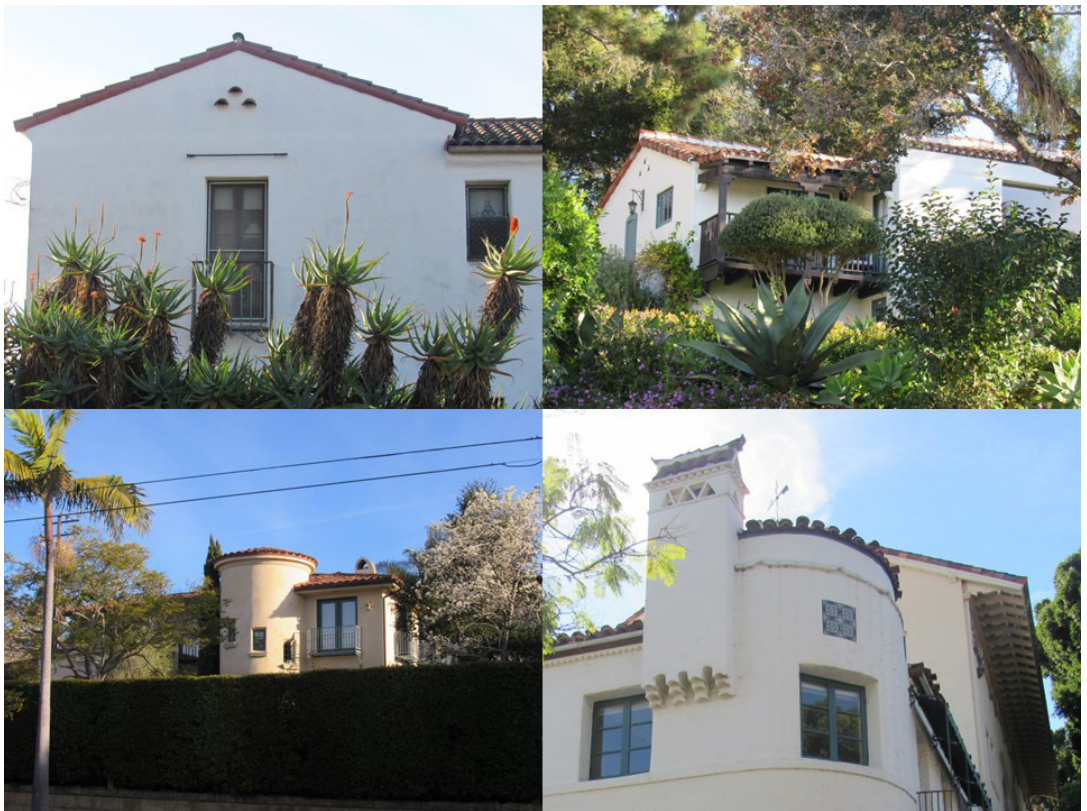
Figura 5 - Juliet Balcony, varanda em balanço, torreão e chaminé, em Santa Bárbara, CA.