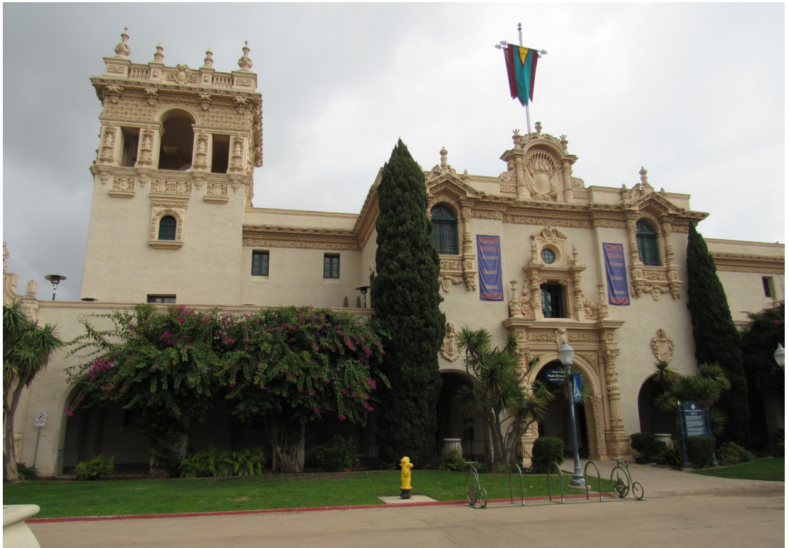
Figura 2 - o antigo Foreign Arts Building , atual House of Hospitality , projetado por um consórcio de arquitetos liderados por Bertrand Goodhue. San Diego (1915).

a exuberância dos edifícios permanentes (Figura 2), que referendavam as obras espanholas do Renascimento e do Barroco, o Plateresco e o Churrigueiresco e, até mesmo, as feições islâmicas do Mudejar, cedeu lugar a uma arquitetura residencial mais singela e menos afeita a elementos decorativos.