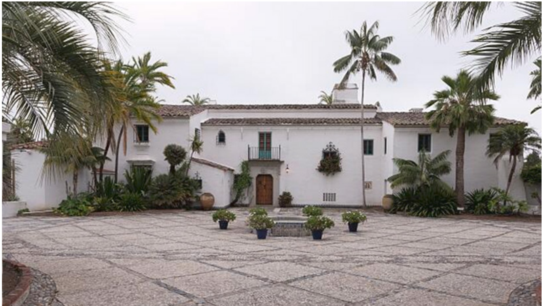
Figura 3 - Residência de George Washington Smith, em Montecito, CA, 1921.

As peculiaridades das formas, entretanto, encontrariam nos detalhes arquitetônicos o seu efeito de complementariedade. As grades de alvenaria, que vazavam os panos cegos das paredes, com o propósito de iluminar e ventilar ambientes internos, lembravam as tradicionais treliças que a presença muçulmana incorporou à arquitetura do sul da Espanha (Gebhard, 2005). Essa necessidade de iluminação e ventilação teria motivado a criação de uma das mais marcantes características do Spanish Colonial Revival : os três cilindros vazados (Figura 6), dispostos em forma de triângulo e instalados nas empenas dos telhados, próximos do vértice (Savage; McAlester, 1994).