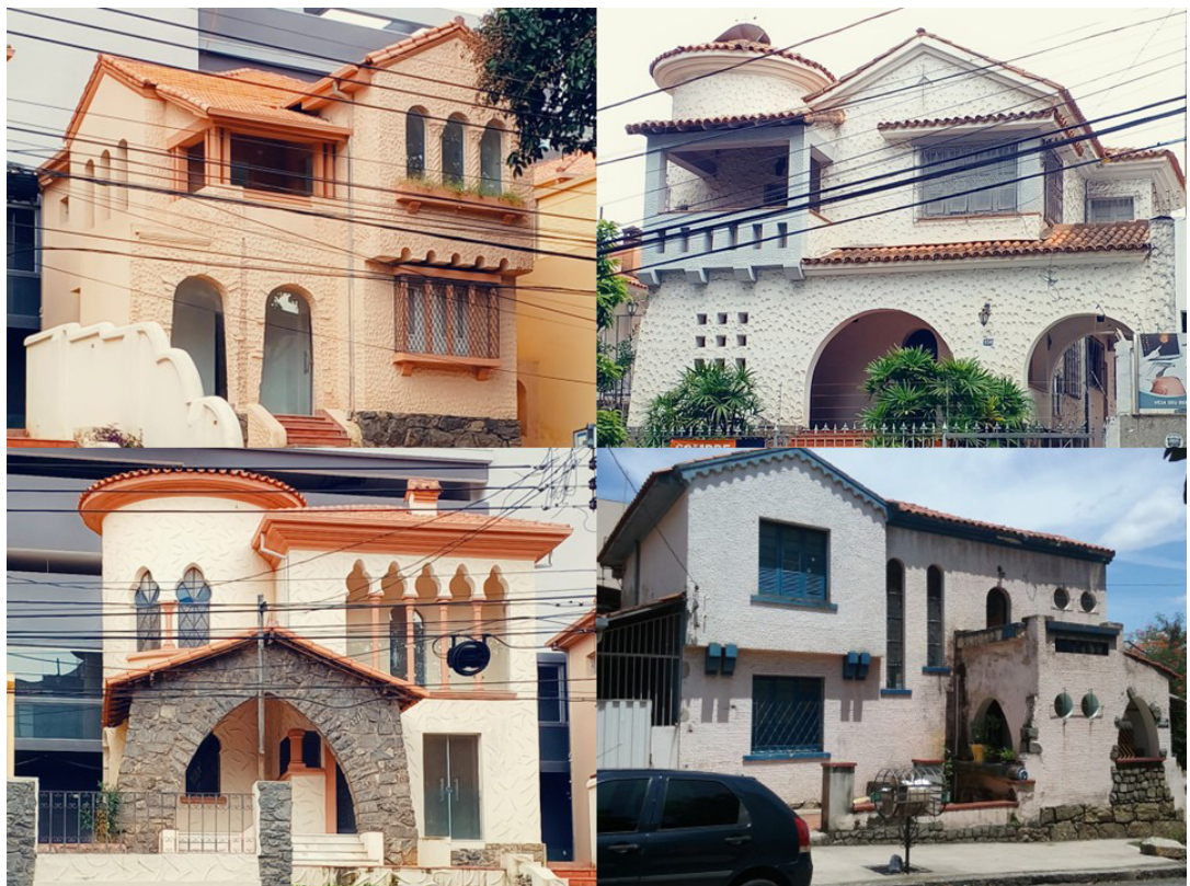
Figura 8 - Exemplos com volumes em balanço apoiado por mísulas, torreões, grade de alvenaria e faixas lombardas.