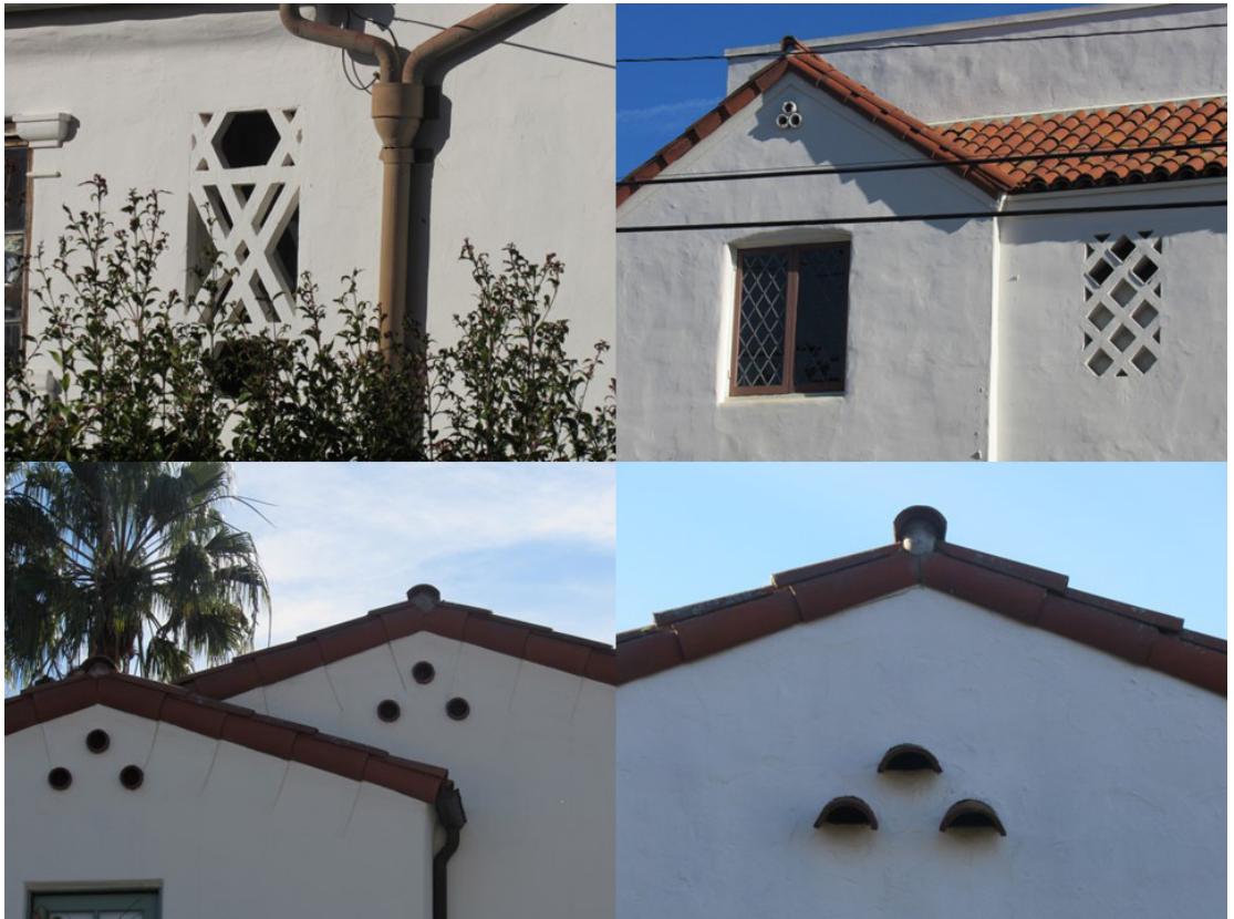
Figura 6 – As grades de alvenaria e os três cilindros dispostos em forma de triângulo, Santa Bárbara, CA.