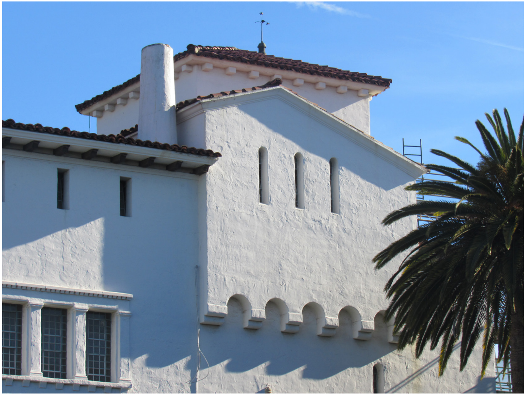
Figura 4 - Detalhe da Santa Barbara Courthouse, projetada por William Mooser & Co., 1923.