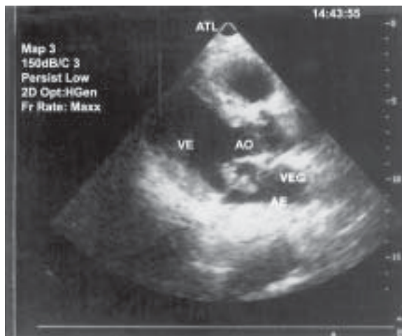
Figura 1. Ecocardiografia revelando vegetação em válvula mitral. VE = Ventrículo esquerdo; AO = Artéria aorta; VEG = Vegetação; AE = Atrio esquerdo.

Ao dar entrada no hospital, o exame físico geral era normal, exceto por apresentar um sopro sistólico em foco mitral 2+/6+ e temperatura de