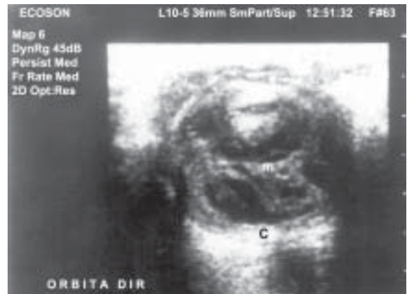
Figura 2. Ultra-sonografia ocular mostrando membranas, ecos vítreos e coróide espessada à direita. M = Membranas vítreas; C = Coróide.

A hemocultura e cultura vítrea foram negativas. Na cultura da secreção conjuntival cresceu Streptococcus sp.