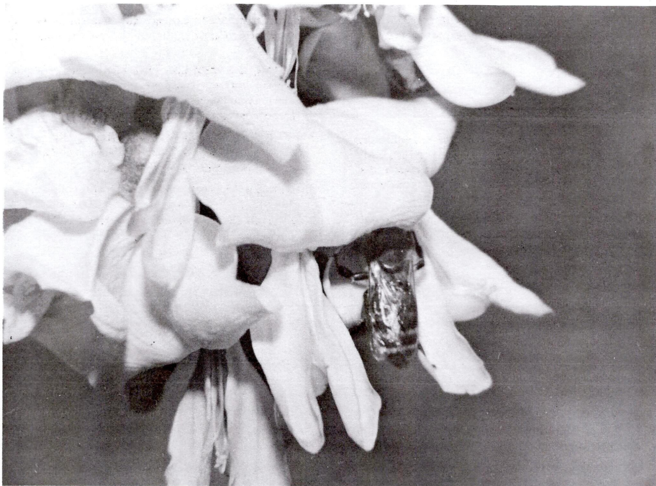
Figura 4. Apis mellifera visitando a flor de Gleditsia triacanthos L. - Leguminosae.