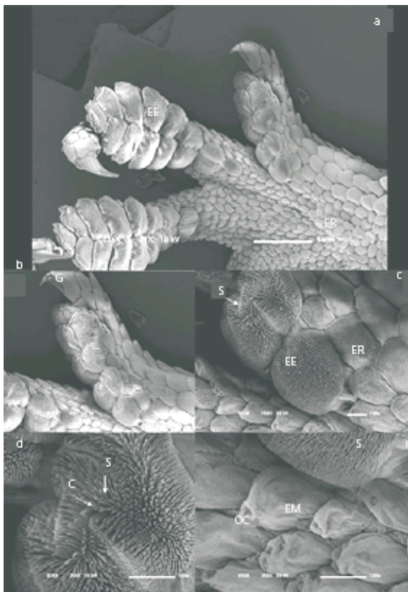
Figura 1. Hemidactylus mabouia . a) visão ventral da pata: escamas de revestimento (ER), garras (G) e estrutura esponjosa (EE); b) visão lateral do dedo: escamas de revestimento (ER), garras (G) e estrutura esponjosa (EE); c) estrutura esponjosa (EE), setas (S), escamas de revestimento (ER) e escamas modificadas (EM); d) setas (S) e cerdas (C); e) setas (S), escamas modificadas (EM) e orifício central (OC).

A pata da lagartixa é composta por escamas de revestimento, garras e estruturas retangulares, com a aparência de uma esponja (Figuras 1a e 1b). Em maior aumento, as estruturas esponjosas são compostas por filamentos ramificados em suas extremidades (Figuras 1c e 1d), também conhecidos por setas e suas ramificações por cerdas. Eles